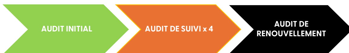
Figure 1 : Cycle de certification

Un cycle de certification FSC se déroule sur 5 ans, incluant 1 audit initial ou de renouvellement et 4 audits de suivi :