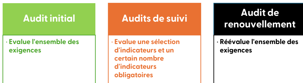
Figure 2 : Résumé des exigences contrôlées sans l'approche par le risque

Lors des audits de suivi , toutes les exigences ne sont pas vérifiées : l'auditeur s'organise pour que, sur les 4 audits de suivi du cycle, l'ensemble des exigences soit vérifié au moins une fois. Pour les forêts de plus de 500 ha abritant des Hautes valeurs de conservation, l'auditeur doit aussi vérifier au cours de chaque audit de suivi, certaines exigences spécifiques (en lien avec la préservation des valeurs environnementales en général, et des HVC en particulier).